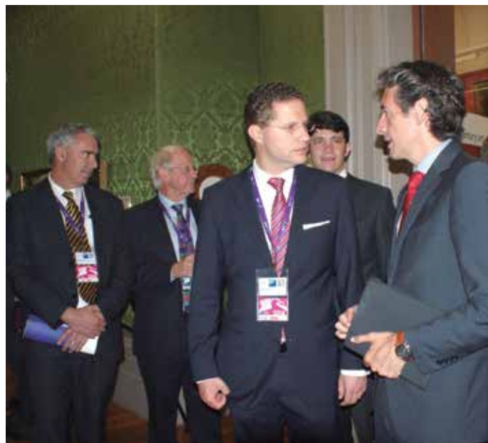
Íñigo de la Serna conversa con el Alcalde Quito, Mauricio Rodas, tras la cumbre.

Respecto de la primera, que tiene que ver con la agenda global de CGLU en lo que concierne a planificación y espacio público, los Comités de Planificación Estratégica, Cultura e Inclusión identificaron este asunto como clave para la agenda del futuro, puesto que los espacios públicos tienen un impacto directo en las vidas de los ciudadanos, ya que son los lugares donde se desarrolla la sociabilidad de la ciudad, donde los ciudadanos interactúan y donde está arraigada la democracia.