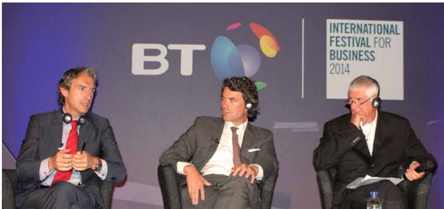
El Presidente de la FEMP interviniendo en la mesa "Ciudades para el crecimiento y la igualdad".

De la Serna indicó que la elaboración de esta propuesta se ha realizado en coordinación con la Secretaría de Estado de Telecomunicaciones