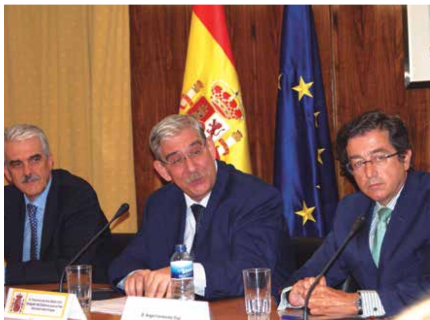
El Secretario General de la FEMP, en primer término a la derecha, acompañó en la presentación al Delegado del Gobierno, en el centro, y al Gerente del Organismo Autónomo Madrid Salud.

Como recordó en la apertura de la jornada el Secretario General de la FEMP, en 2012 comenzó una investigación centrada en el estudio de la difusión del programa en el territorio nacional, el análisis de las vías de implantación del programa y una comparativa de toda la documentación propia cedidas por los nueve municipios y la Comunidad Autónoma, antes mencionados.