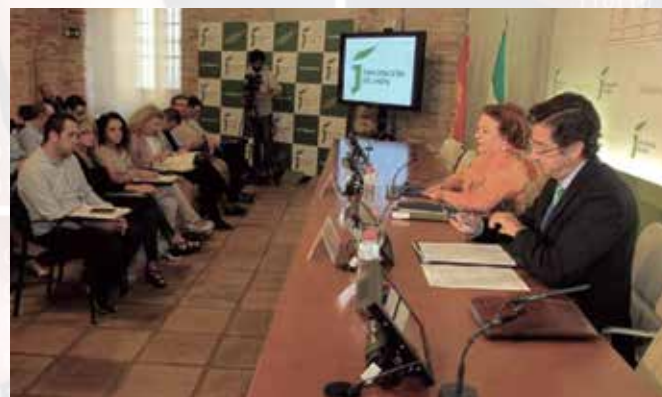
Acto de presentación celebrado en la Diputación de Jaén.

La Región de Murcia es la zona en la que se encuentra el 44,4% de las Entidades adheridas a la Central de Contratación; en su capital, y en la sede de su Federación de Municipios, se celebró el 3 de julio la jornada informativa sobre la Central de Contratación.