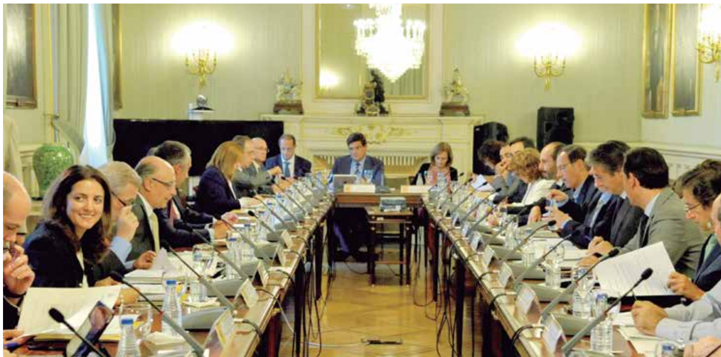
En la CNAL se dieron a conocer los objetivos de déficit para el próximo trienio.

El segundo factor lo resumió diciendo que un Ayuntamiento es un elemento vivo, dinámico y sometido a variables a lo largo de todo un año. Por ello sería preciso aportar una lista más amplia de excepciones para el cumplimiento del techo de gasto en la que contemplar "algunos casos que consideramos extraordinarios".