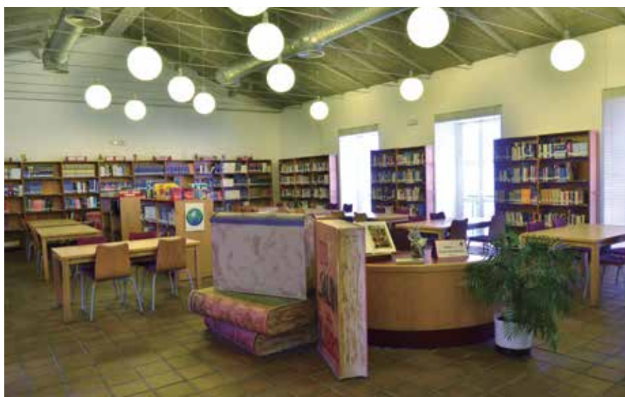
La Junta informó la propuesta de la Federación al Real Decreto que regula la remuneración a los autores por el préstamo de sus obras en bibliotecas.

Además de esta cuestión, la Junta dio su visto bueno a la firma de varios convenios y protocolos, entre ellos, el de colaboración con el Consejo Superior de Deportes para la realización de acciones conjuntas que faciliten la celebración de eventos deportivos en las Entidades Locales (más información en la página 23). ★