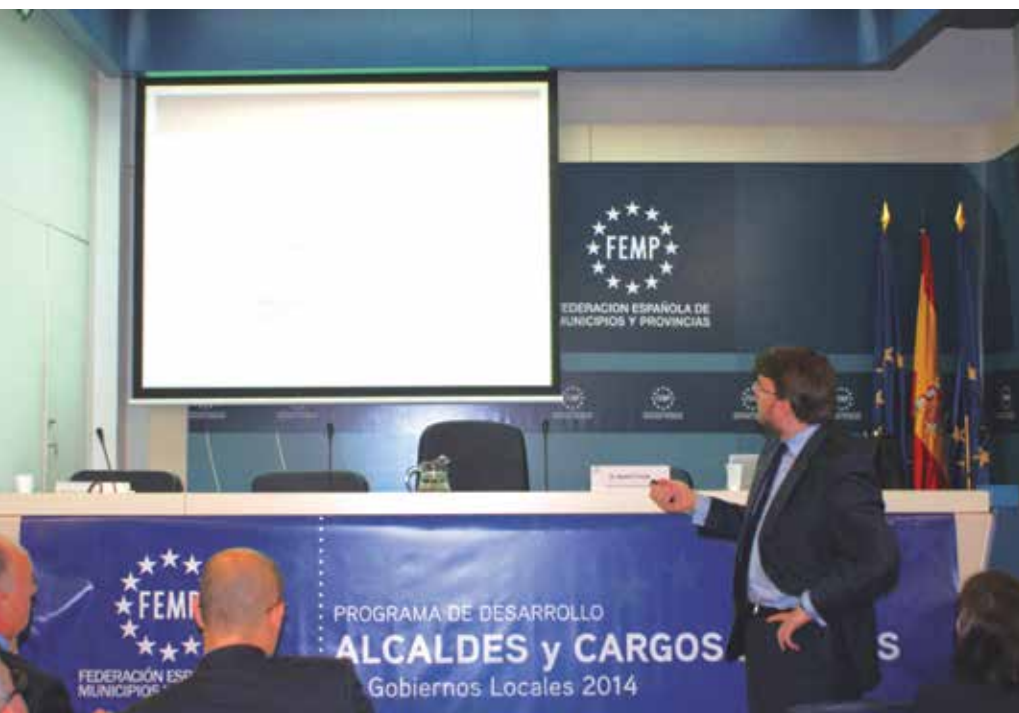
Seminario sobre Liderazgo político y comunicación, celebrado en la sede de la FEMP.

La creación del mensaje político y las claves para la redacción de discursos centraron la última parte del se-