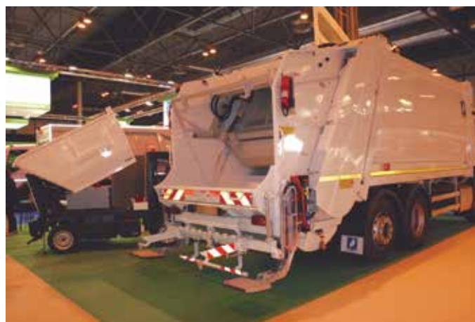
Camiones para la recogida de residuos en el espacio de la Feria.

También hubo una numerosa presencia de representantes municipales de países de América Latina, en concreto de países como México, Perú, Paraguay, Brasil, Honduras y Bolivia, entre otros. ★