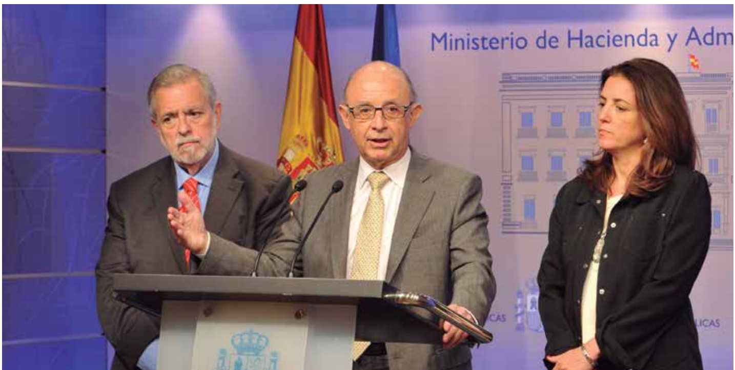
El Ministro, junto al Secretario de Estado de Administraciones Públicas y la Secretaria General de Coordinación Autonómica y Local, durante su comparecencia posterior a la reunión.

La reforma tributaria emprendida por el Gobierno no afecta a la fiscalidad local, según se constató en la Comisión, una cuestión que desde la FEMP se valoró positivamente por lo que supone de respeto a la autonomía local. Íñigo de la Serna añadió que el Ministerio había explicado a los representantes locales diferentes aspectos de la reforma e invitado