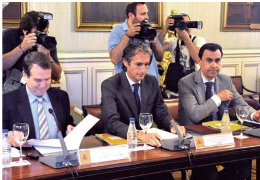
El Presidente y los dos Vicepresidentes de la FEMP, en los minutos previos a la Comisión.

En cuanto a los objetivos de deuda pública para la Administración Local, también en porcentaje sobre Producto Interior Bruto, se fijan en 9,9 para 2015; 3,8 para 2016; y 3,6 para 2017. Estos son aún más