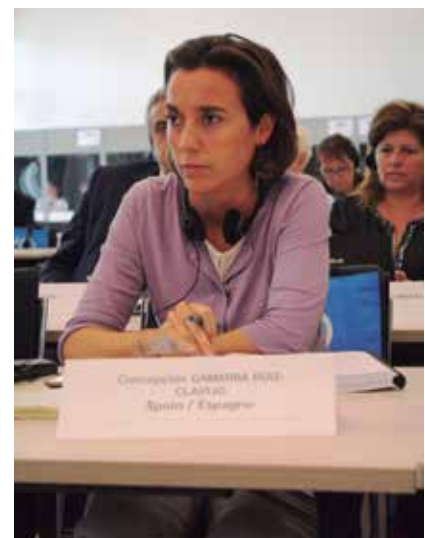
El Alcalde de Valladolid, Javier León de la Riva, y la Alcaldesa de Logroño, Cuca Gamarra, durante la reunión de Lodz.

de Estado y sobre la revisión de la legislación sobre el IVA relativa a su exención en los servicios de interés público. En este sentido, determinó que la diversidad de los regímenes tributarios reflejan la diversidad de los Estados miembros y deben ser respetados por la Comisión.