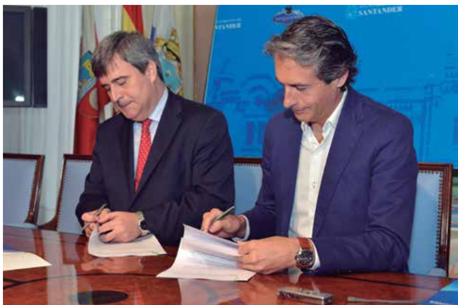
El Presidente del CSD, Miguel Cardenal, y el Presidente de la FEMP, Íñigo de la Serna, suscriben el acuerdo.

En el marco del acuerdo, que tiene una duración de un año, con posibilidad de prórroga hasta un límite de cuatro, las dos partes se comprometen a colaborar activamente para favorecer la celebración de eventos de interés y, además, a darles difusión a través de todos sus medios.★