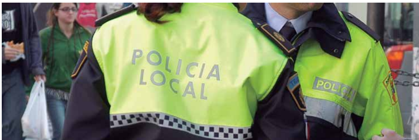
El Agente Tutor es un programa de la Policía Local, en colaboración con otros servicios municipales, que centra su actuación en el ámbito de la prevención y protección del menor

La acción preventiva es el arma más eficaz para enfrentarse al problema del consumo de drogas, sobre todo entre los más jóvenes, y el municipio es el lugar donde se puede desarrollar con mayor eficacia. Para ello, las Entidades Locales disponen de herramientas y de mecanismos como el Programa Agente Tutor, que la Delegación del Gobierno para el Plan Nacional sobre Drogas y la FEMP quieren extender al mayor número de Ayuntamientos posible.