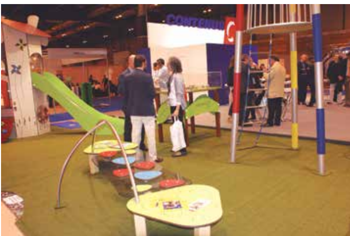
A TECMA acudieron cerca de medio millar de empresas de 17 países.

El Foro de las Ciudades, según los organizadores, pretende convertirse en el lugar donde las Entidades Locales y los ciudadanos ponen en valor las sinergias para construir una " ciudad con ciudadanía ", en la que el factor humano prime entre los requisitos necesarios para diseñar espacios urbanos habitables. También es una cita para las empresas y el mundo científico-académico, agentes potencias que proporcionan las claves para conocer hacia dónde caminan las ciudades para convertirse en lugares sostenibles y eficientes.